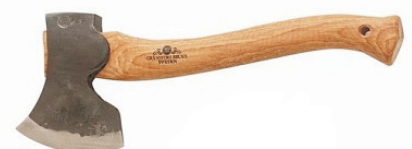
Duża siekiera rzeźbiarska Gransfors Bruks