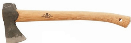
Siekiera myśliwska szwedzkiej firmy Gransfors Bruks

Współczesne siekiery nadal przypominają kształtem te pierwotne, jednak materiały obecnie używane do ich produkcji to już często technologia prawie kosmiczna! Współczesny wysokowydajny przemysł wypłuka setki tysięcy takich produktów, które są może i dobre ale brakuje im jednej podstawowej cechy, tak ważnej dla prawdziwych koneserów, duszy!