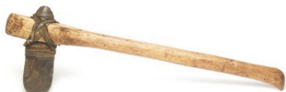
Siekiera(głowica) z okresu neolitu, znaleziona w Tamizie, w hrabstwie Kent.

Siekiera towarzyszy człowiekowi od epoki kamienia (około 10 tys. lat p.n.e.), kiedy to wpadł on na pomysł połączenia kawałka kamienia z kijem. Od tego pomysłu swój początek bierze kilka podstawowych, prostych, wręcz trywialnych narzędzi: siekiera, topór, maczuga, młotek, motyka. Kiedy zastanowimy się przez chwilę, dojdziemy do wniosku, że to właśnie dzięki tym narzędziom powstała nasza cywilizacja! No bo trudno byłoby zbudować potęgę pierwszych osad, a później wsi i miast bez młotka i siekiery. A topór i maczuga, które zapewniały władzę i bezpieczeństwo naszych przodków? No i nawet ta niepozorna motyka, która zapewniała wikt całym rodzinom!