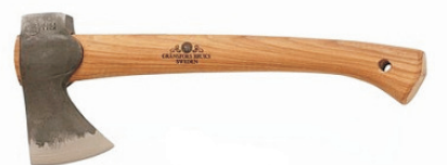
Toporek outdoorowy Gransfors Bruks